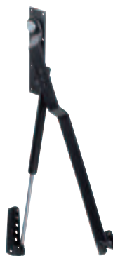
Ferrure pour un côté