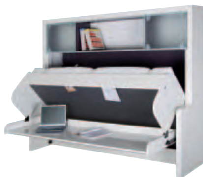
Déplacements simultanés des plateaux respectivement vers le bas et le haut