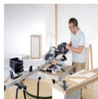
複合切断も高精度に