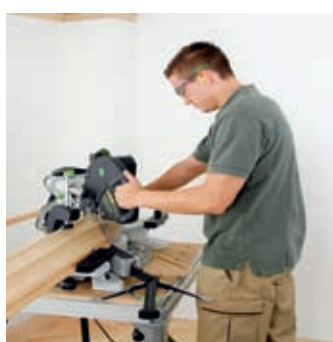
装飾材も正確に切断