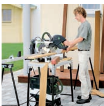
MFT作業台、集塵機とセット