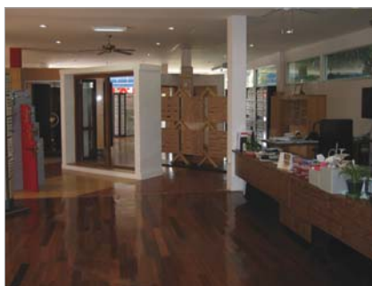
Häfele Design Studio in Phuket สาขาภูเก็ต