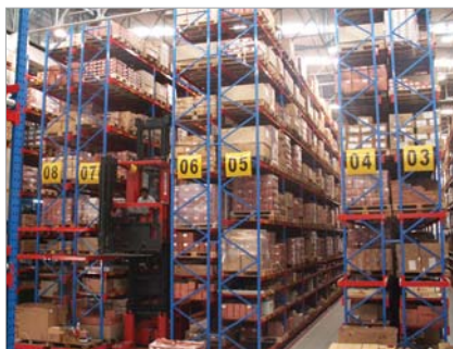
Häfele Warehouse in Bangkok คลังสินค้าที่สำนักงานใหญ่ กรุงเทพฯ ฯ