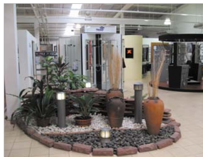
Häfele Design Studio in Pattaya สาขาพัตยา