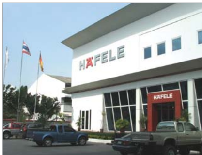
Häfele Design Studio in Bangkok สำนักงานใหญ่ กรุงเทพฯ ฯ

ด้วยเทคโนโลยีที่ทันสมัยเองที่ทำให้เราสามารถตอบสนองต่อปริมาณคำสั่งซื้อกว่า 2,000 คำสั่งในแต่ละวันได้อย่างมีประสิทธิภาพ