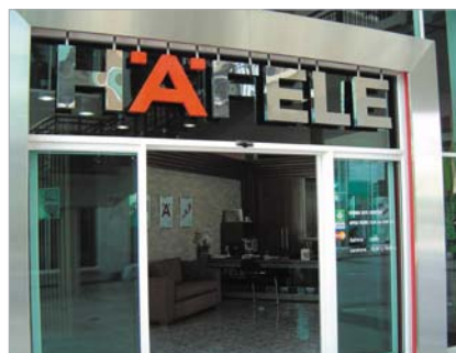
Häfele Design Studio in Hua Hin สาขาหัวหิน