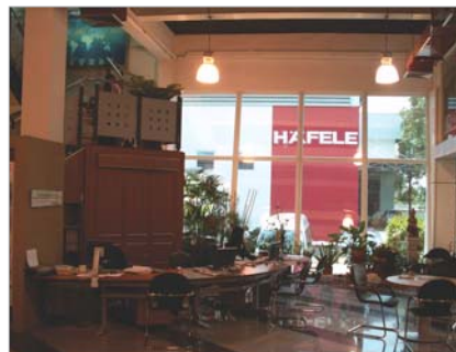
Häfele Design Studio in Bangkok สำนักงานใหญ่ กรุงเทพฯ ฯ