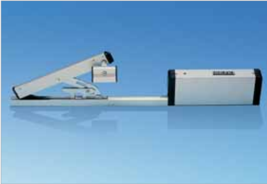
GEZE 212 with OL 90

อุปกรณ์เปิดหน้าต่าง รุ่น OL 90 N แบบควบคุมด้วยไฟฟ้า GEZE