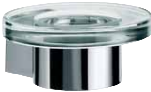
Soap holder 980.50.410 ที่วางสบู่