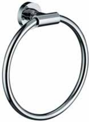
Towel ring ห่วงแขวนผ้า 980.50.929