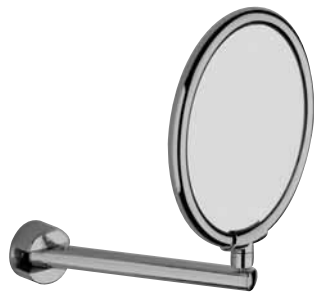
Mirror, 2-sided 980.50.024 กระจก 2 ด้าน