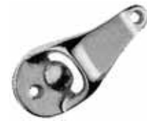
Bottle opener ที่เปิดขวด