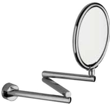
Mirror, 2-sided 980.50.025 กระจก 2 ด้าน