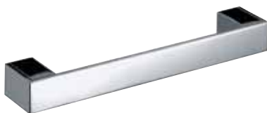
Grip handle 980.50.405 มือจับกันลื่น