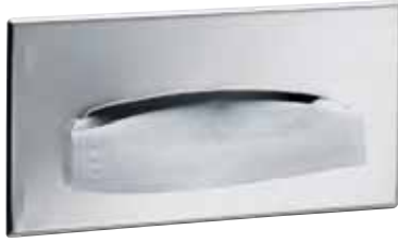
Tissue box, concealed 980.50.018 กล่องใส่กระดาษชำระแบบฝังผนัง