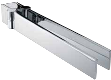
Towel holder 280 mm 980.50.422 ราวแขวนผ้าแบบพับได้ 280 มม. ขนาด 430 mm 980.50.423 430 มม.