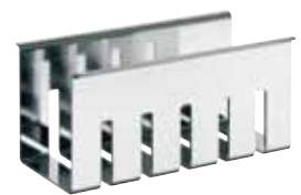
Dish, high 980.50.437 จานวางของ