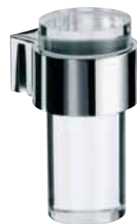
Gallery glass holder 980.50.416 ที่วางแก้วรุ่นกาแล็กซี่