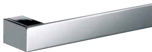
Towel holder ราวแขวนผ้า 980.50.424