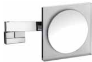
LED Mirror 980.50.104 กระจกแบบมีไฟ