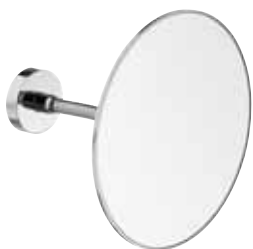
Mirror 980.50.046 กระจก