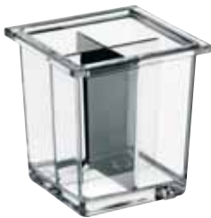
Accessories box 980.50.431 กล่องเก็บอุปกรณ์