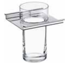
Glass holder 980.50.433 ที่วางแก้ว