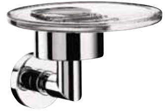
Soap dish ที่วางสบู่ 980.50.905