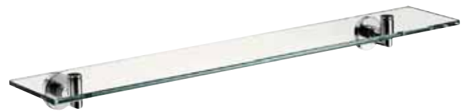
Glass shelf 500 mm 980.50.910 ชั้นวางของขนาด 500 มม. 700 mm 980.50.911 700 มม.