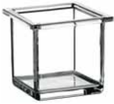
Glass dish, deep 980.50.428 แก้ววางของ (ลึก)