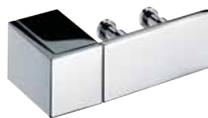
Hook rail ขอแขวนผ้า 980.50.419