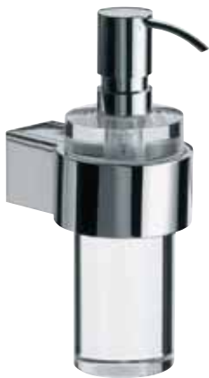
Soap dispenser 980.50.417 อุปกรณ์ที่กดสบู่เหลว