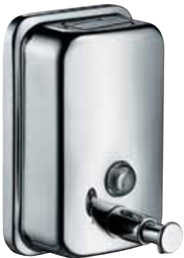
Soap dispenser 980.50.013 อุปกรณ์ที่กดสบู่เหลว