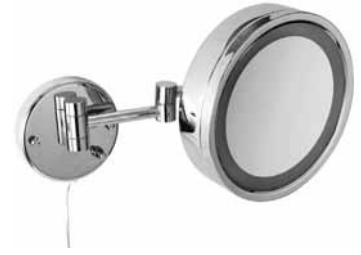
Light Mirror, chrome coloured กระจกแต่งหน้า ชนิดมีไฟ สีโครม 980.64.502