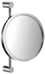
Mirror 980.50.023 กระจก