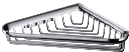
Corner sponge dish, 228 mm 980.50.041 ชั้นวางของ แบบตะแกรงเข้ามุม 228 มม.