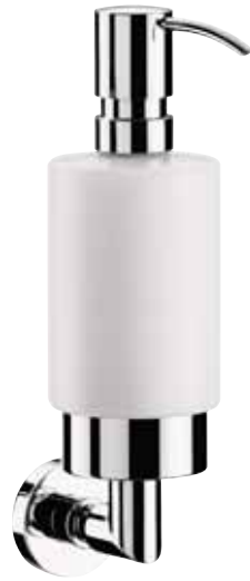
Soap dispenser อุปกรณ์ที่กดสบู่เหลว 980.50.904