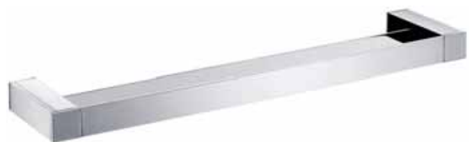
Towel bar, 600 mm 980.50.425 ที่แขวนผ้าขนาด 600 มม.