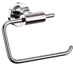
Paper holder 980.50.900 ที่ใส่กระดาษชำระ