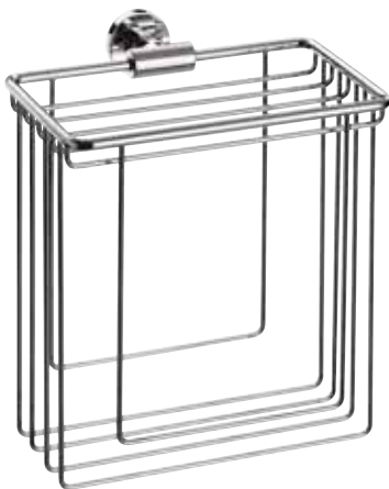
Towel basket ตะกร้าเก็บผ้า 980.50.925