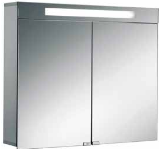
Mirror cabinet 980.50.112 ตู้กระจก พร้อมกระจก