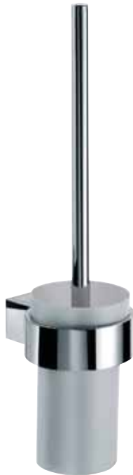
Toilet brush set 980.50.414 แปรงขัดสุขภัณฑ์