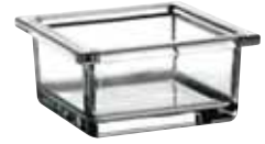
Glass dish, square 980.50.427 แก้ววางของ