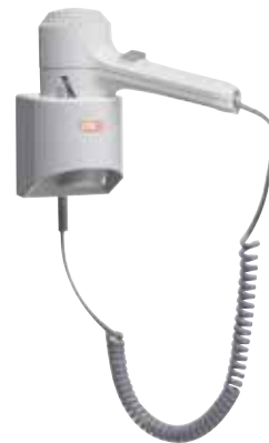
Hair dryer, fixed position 980.50.098 ที่เป่าผม