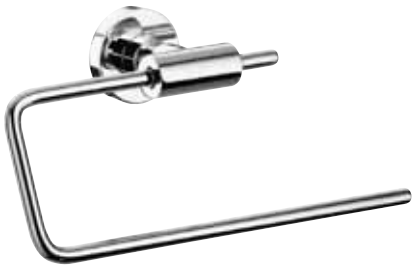
Towel holder ราวแขวนผ้า 980.50.924