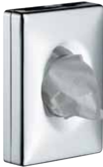
Hygiene bag box 980.50.007 กล่องใส่กระดาษชำระ