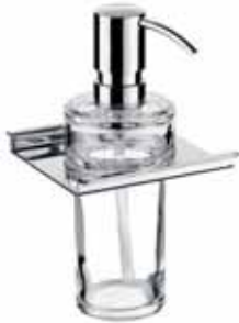
Soap dispenser 980.50.434 อุปกรณ์ที่กดสบู่เหลว