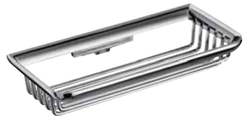
Sponge dish, 200 mm ชั้นวางของแบบตะแกรง 200 มม.