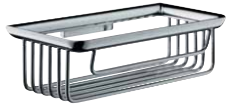
Sponge dish, 200 mm ชั้นวางของแบบตะแกรง 200 มม.