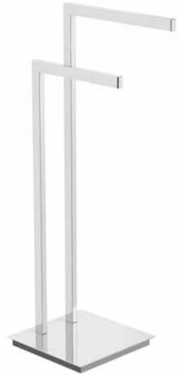
Towel holder 980.50.350 ที่แขวนผ้าแบบตั้งพื้น