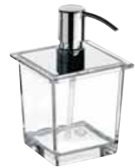
Soap dispenser 980.50.435 อุปกรณ์ที่กดสบู่เหลว