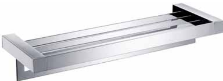
Towel rack 980.50.426 ชั้นวางผ้า