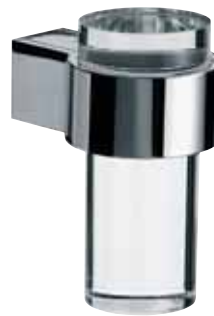
Glass holder 980.50.415 ที่วางแก้ว