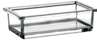
Glass dish, long 980.50.429 แก้ววางของ (ยาว)