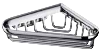
Corner sponge dish, 159 mm 980.50.040 ชั้นวางของ แบบตะแกรงเข้ามุม 159 มม.