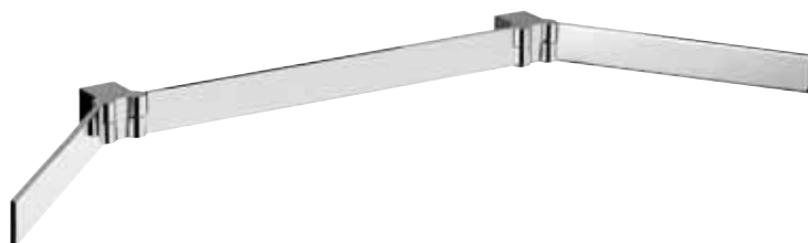
Dry rack/gallery ราวแขวนผ้า รุ่นกาแล็คซี่ ขนาด 431 mm 431 มม. 980.50.400 662 mm 662 มม. 980.50.401 821 mm 821 มม. On request