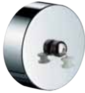
Pull-out clothesline 980.50.081 อุปกรณ์ราวตากผ้า

Please see technical details page 258–259.