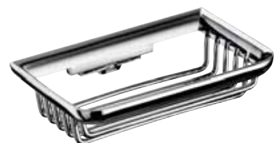
Sponge dish, 150 mm ชั้นวางของแบบตะแกรง 150 มม.