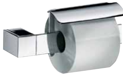
Paper holder 980.50.412 ที่ใส่กระดาษชำระ พร้อมฝาปิดด้านบน