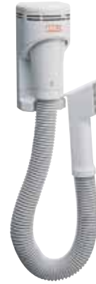
Hair dryer, with air-hose 980.50.099 ที่เป่าผม