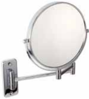
Mirror, 2-sided กระจก 2 ด้าน 980.64.512