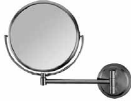
Mirror, 2-sided กระจก 2 ด้าน 495.81.000