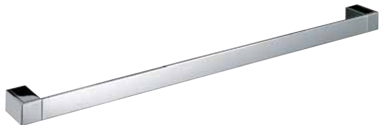
Bath towel holder 640 mm 980.50.420 ราวแขวนผ้าขนาด 640 มม. 800 mm 980.50.421 800 มม.