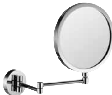
Mirror, 2-sided 980.50.021 กระจก 2 ด้าน