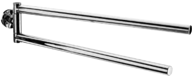
Towel holder 363 mm 980.50.920 ราวแขวนผ้า 363 มม. แบบพับได้ ขนาด 465 mm 980.50.921 465 มม.

Please see technical details page 256-257.