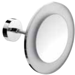
LED Mirror 980.50.110 กระจกแบบมีไฟ