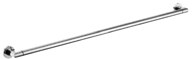
Bath towel holder 600 mm 980.50.922 ราวแขวนผ้าขนาด 600 มม. 800 mm 980.50.923 800 มม.