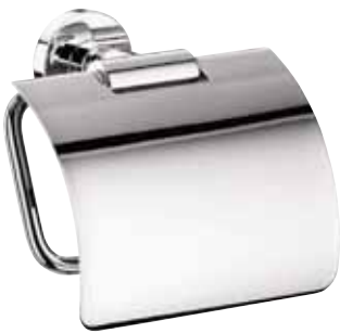
Paper holder 980.50.901 ที่ใส่กระดาษชำระ แบบมีฝาปิด