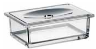
Glass dish with cover 980.50.438 แก้ววางของ