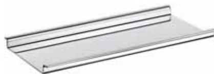
Dish 980.50.432 จานวางของ