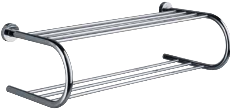
Towel rack ชั้นวางผ้า