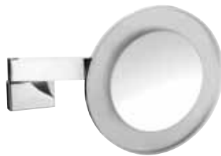
LED Mirror 980.50.108 กระจกแบบมีไฟ