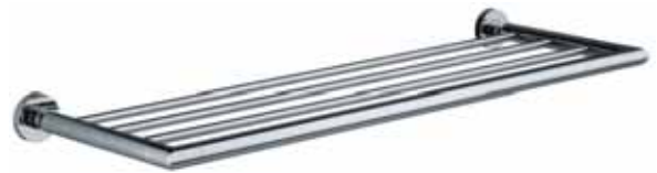
Towel rack, 600 mm ชั้นวางผ้าขนาด 600 มม. 980.50.926