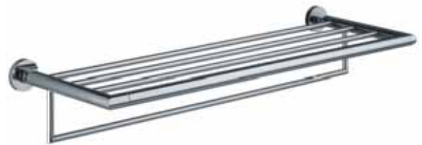
Towel rack, 600 mm ชั้นวางผ้า พร้อมมราวแขวน ขนาด 600 มม. 980.50.927