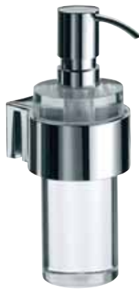
Gallery soap dispenser 980.50.418 อุปกรณ์ที่กดสบู่เหลว รุ่นกาแล็กซี่