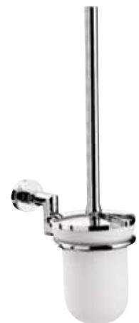
Toilet brush set 980.50.906 แปรงขัดสุขภัณฑ์