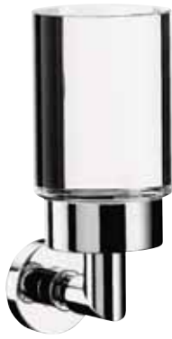
Glass holder ที่วางแก้ว 980.50.903