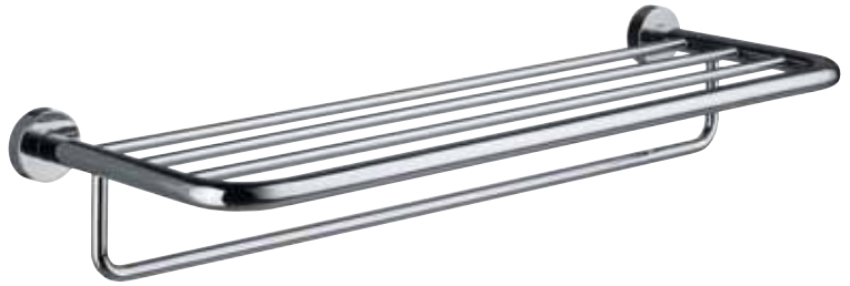
Towel rack 980.50.079 ชั้นวางผ้าพร้อมราวแขวน