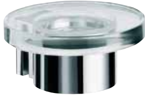
Gallery soap holder 980.50.411 ที่วางสบู่ รุ่นกาแล็คซี่