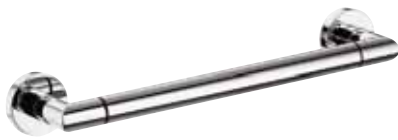
Grip handle มือจับกันลื่น 980.50.907