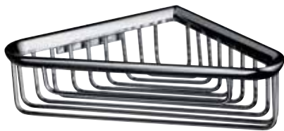
Corner sponge dish, 228 mm 980.50.042 ชั้นวางของ แบบตะแกรงเข้ามุม 228 มม.