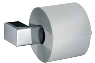
Spare paper holder 980.50.413 ที่ใส่กระดาษชำระ