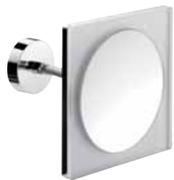
LED Mirror 980.50.106 กระจกแบบมีไฟ