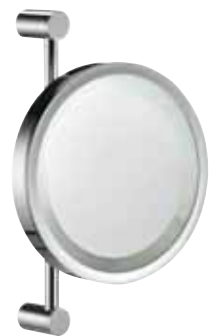
Mirror, illuminated 980.50.022 กระจกเรืองแสง