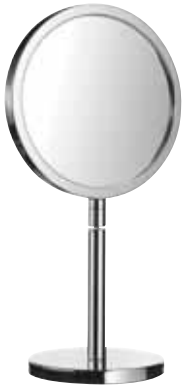
Mirror 980.50.087 กระจก