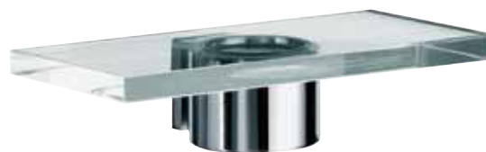
Gallery shelf ชั้นวางของ รุ่นกาแล็คซี่ 980.50.404