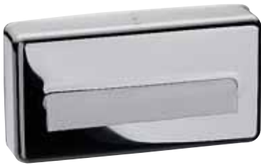
Tissue box 980.50.019 กล่องใส่กระดาษชำระ