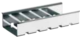
Dish, flat 980.50.436 จานวางของ